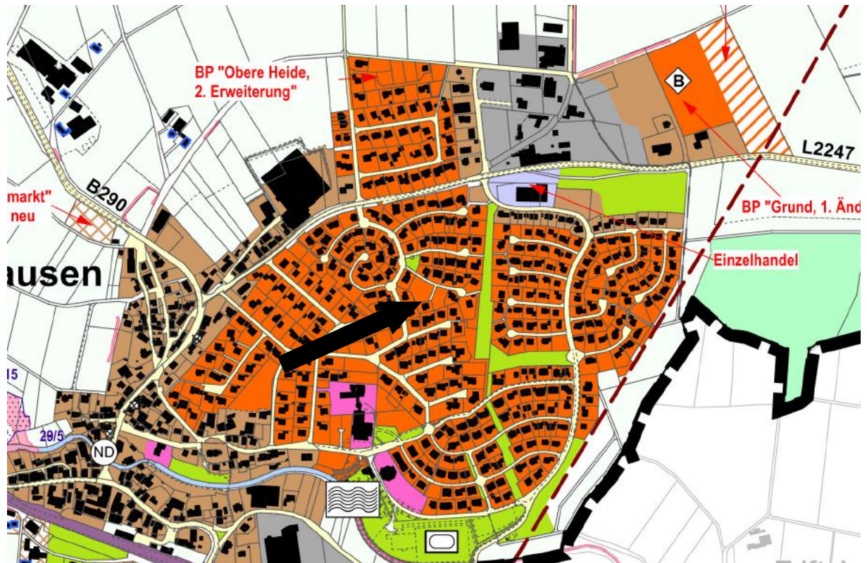
Bild 2: Flächennutzungsplan "Brettach/Jagst 2008, 1. Änderung", 1:10.000