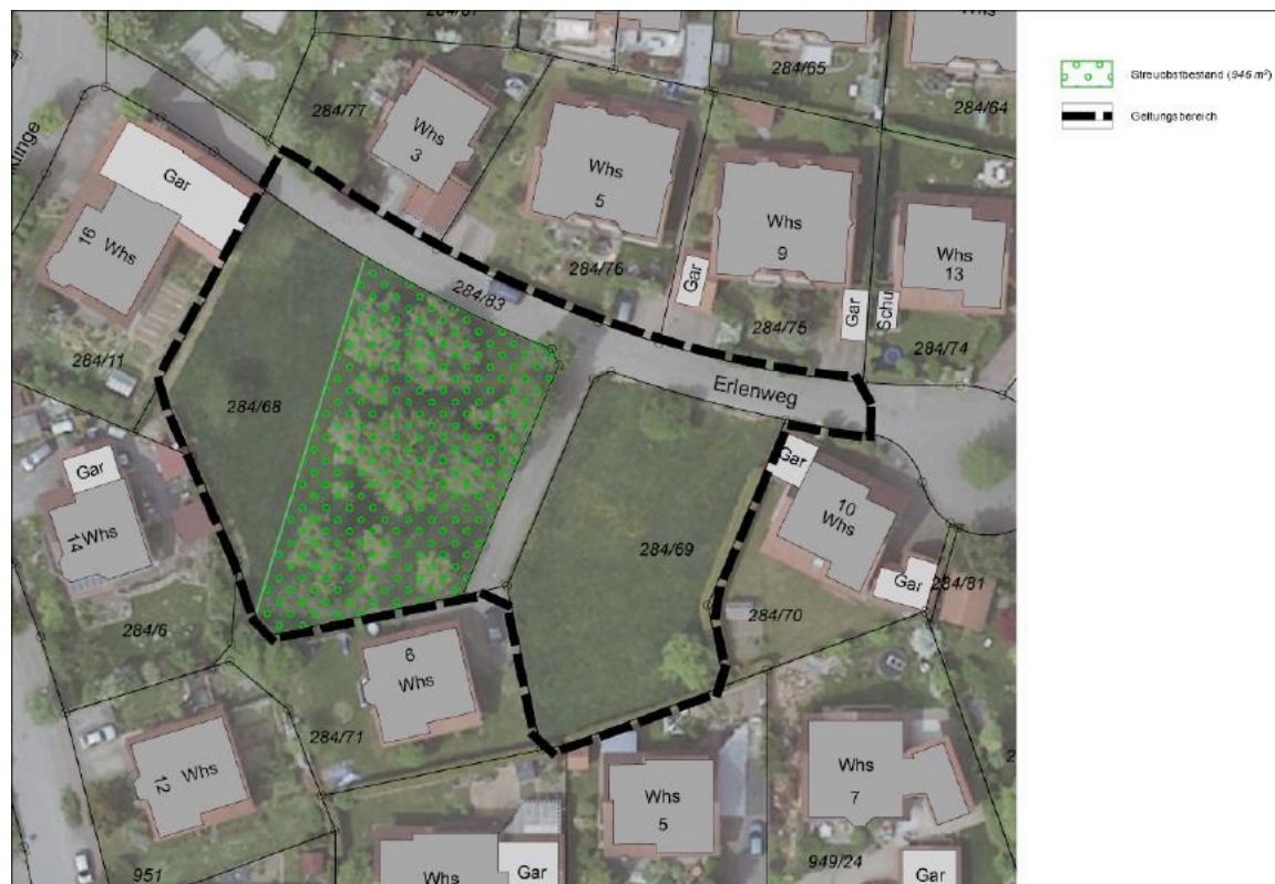
Bild 4 Bestand Streuobstwiese