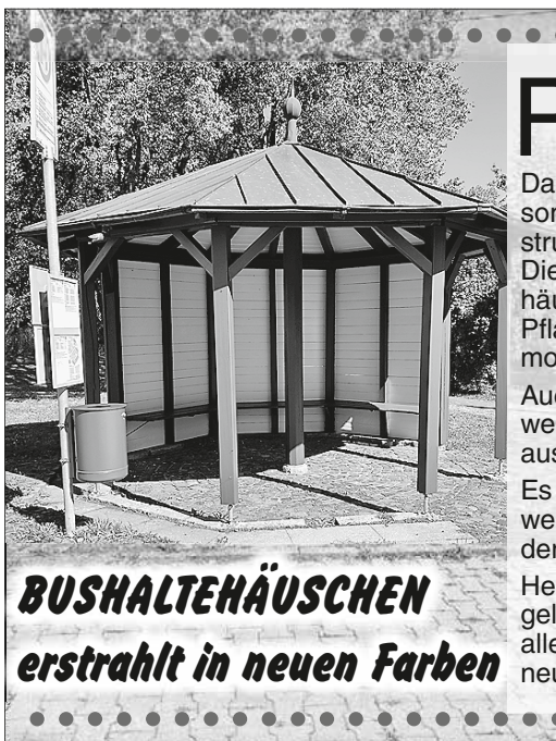
BUSHALTEHÄUSCHEN erstrahlt in neuen Farben

P ünktlich zur Kirchweih am kommenden Wochenende erstrahlt das Bushaltehäuschen in Michelbach an der Lücke in neuen Farben.