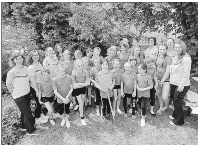
Bericht: Bettina Krämer

Für das Hohenloher Jugendturnfest, das am 20. Juli in Gaildorf ausgetragen wird, haben sich somit 14 Turnerinnen weiterqualifiziert.