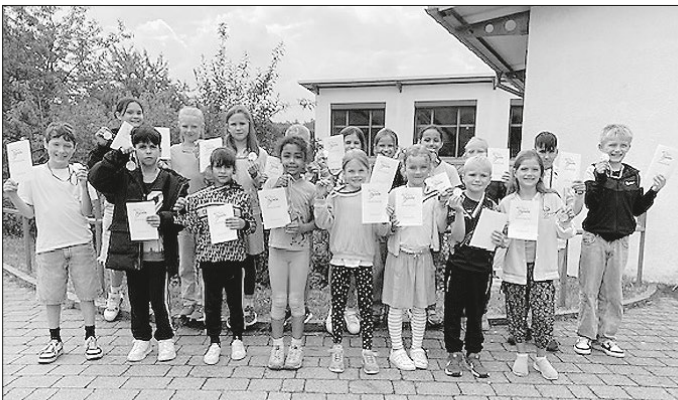
Bild zeigt alle Gewinner einer Goldmedaille.

Bei den diesjährigen Bundesjugendspielen waren unsere Schüler mit Feuereifer am Start und konnten richtig gute Leistungen erzielen. Die Gewinner einer Ehrenurkunde und der damit verliehenen Goldmedaille wurden dann nach der großen Pause in einer Schulversammlung auf dem Pausenhof geehrt.