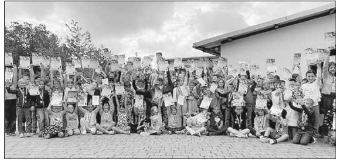
Bild zeigt alle 99 Teilnehmer bei SpoSpiTo