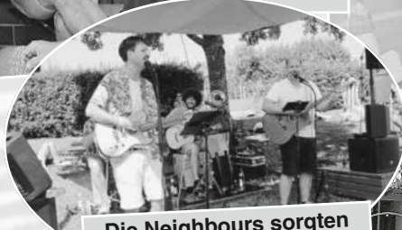
Die Neighbours sorgen für super Unterhaltung!