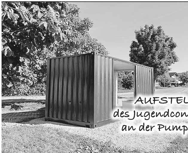
AUFSTELLUNG des Jugendcontainers an der Pumpstation

Der von der Gemeinde beschlossene mobile Jugendcontainer wurde nun erfolgreich an der Pumpstation am Weidenbach aufgestellt. Damit steht Jugendlichen und jungen Erwachsenen ab sofort ein zentraler und wettergeschützter Treffpunkt zur Verfügung.