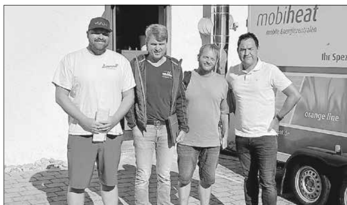
Vergabe Kulturhaus Pelletheizung – Heizungsinstallationsarbeiten

Im Anschluss fand eine nicht öffentliche Gemeinderatssitzung statt.