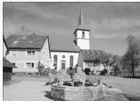
Ev. St.-Michael-Pfarrkirche Michelbach