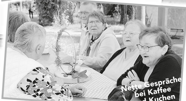
Nette Gespräche bei Kaffee und Kuchen

• und zu guter Letzt ein herzliches Dankeschön an alle Mitstreiter im Ortschaftsrat für die Planung, die gute Zusammenarbeit und den aktiven Einsatz über die Kirchweih. Sei es beim Aufbau, sichernd am Kletterbaum, mit guter Laune bei der Kärwa-Gaudi, im Ausschankwagen oder bei der Kaffee- und Kuchenausgabe auf dem Dorfplatz.