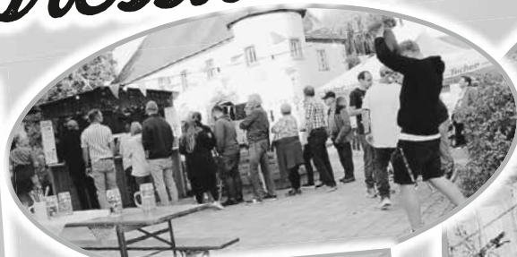
Samstagabend Schlachtschüssel am Dorfplatz