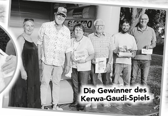
Die Gewinner des Kerwa-Gaudi-Spiels