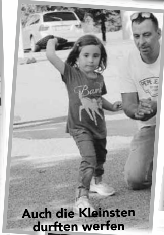
Auch die Kleinsten durften werfen