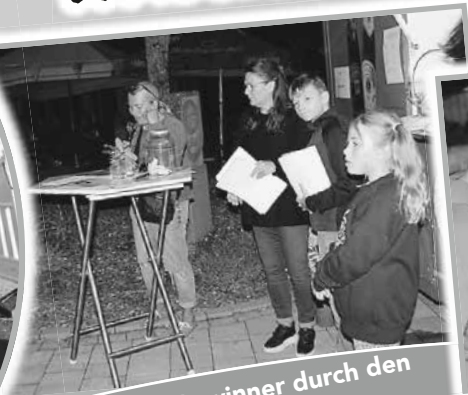
Ziehung der Gewinner durch den Ortschaftsrat