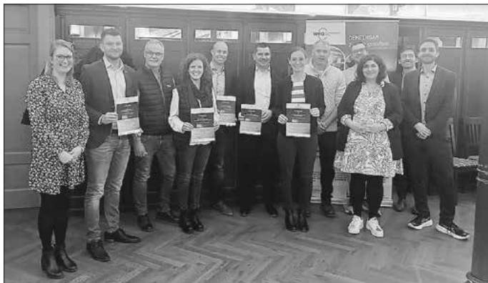
Auszeichnung der ersten fünf KLIMAFit-Betriebe im Landkreis Schwäbisch Hall

In einer feierlichen Abschlussveranstaltung wurden die Projektteilnehmenden mit der Auszeichnung „KLIMAFit-Betrieb“ für ihr Engagement im Bereich des betrieblichen Klimaschutzes belohnt.